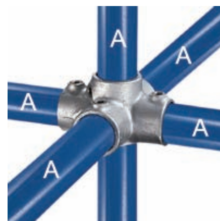
Żelazna kształtki KEE KLAMP - złączki rurowe żeliwne ocynkowane