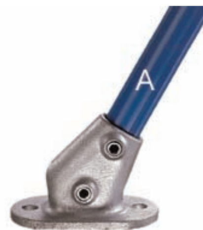
Żelazna kształtki KEE KLAMP - złączki rurowe żeliwne ocynkowane